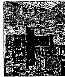
"China Development" și "Commerzbank" - rivali în lupta pentru "Diaspora"?