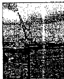
"Aker Mada" un fero 17 nave, anul acesta